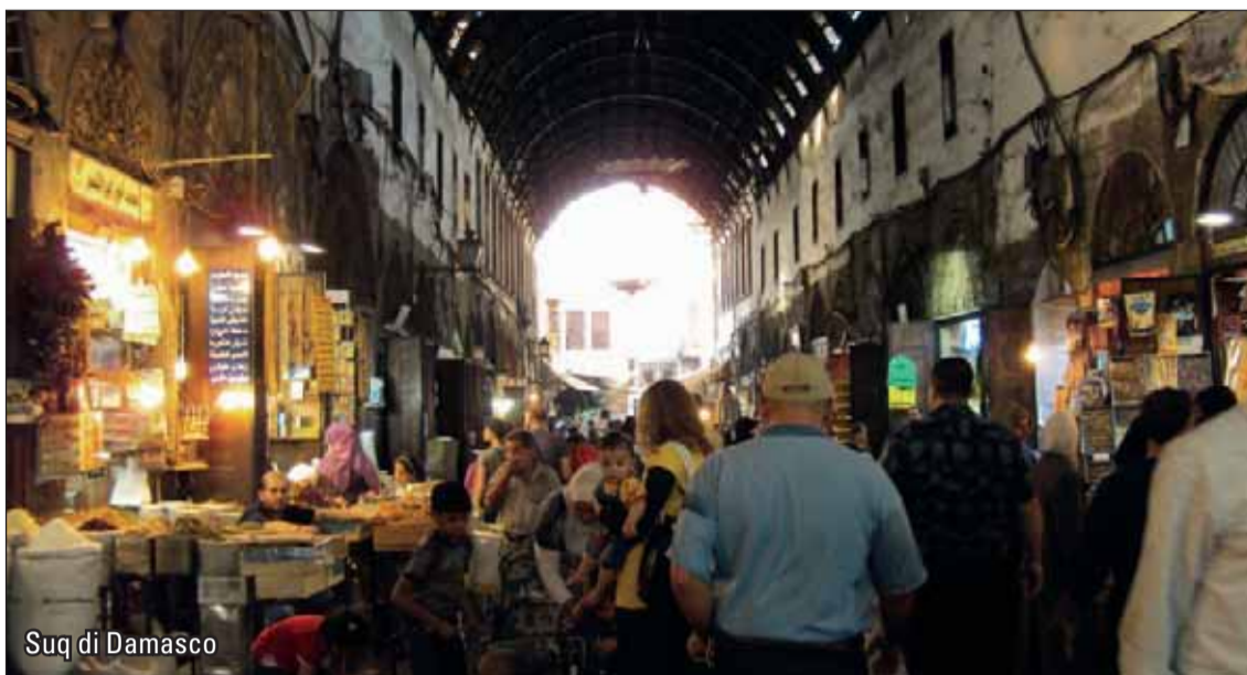
Suq di Damasco