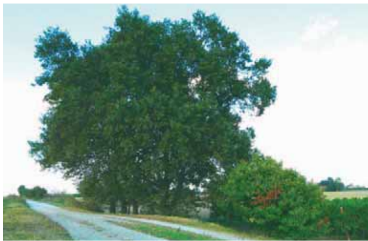
La Farnia ( Quercus pedunculata ) in località Taglio Corelli