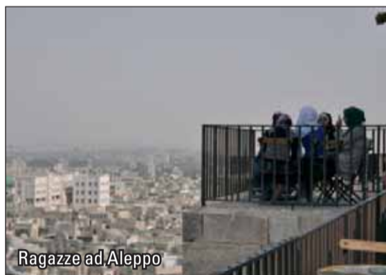
Ragazze ad Aleppo

se solo presenza, in realtà dirigeva una partita dove tutti scendevano in campo in una confusione apparente. Questo è ordine, imparate italiane! Ci infiliamo nel suq della città vecchia, cambiamo traffico, per ora siamo solo pedoni che camminano con altri pedoni, qui si può trovare di tutto: spezie, oro, dolci, profumi e tessuti. Se annusi un tessuto scopri che sa di spezie, se as-