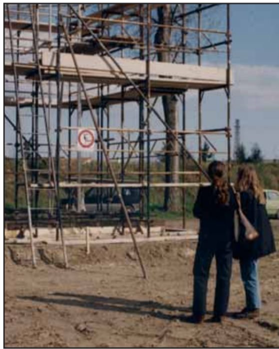
Foto in alto: il giorno dell'inaugurazione; sotto, fasi della costruzione del monumento