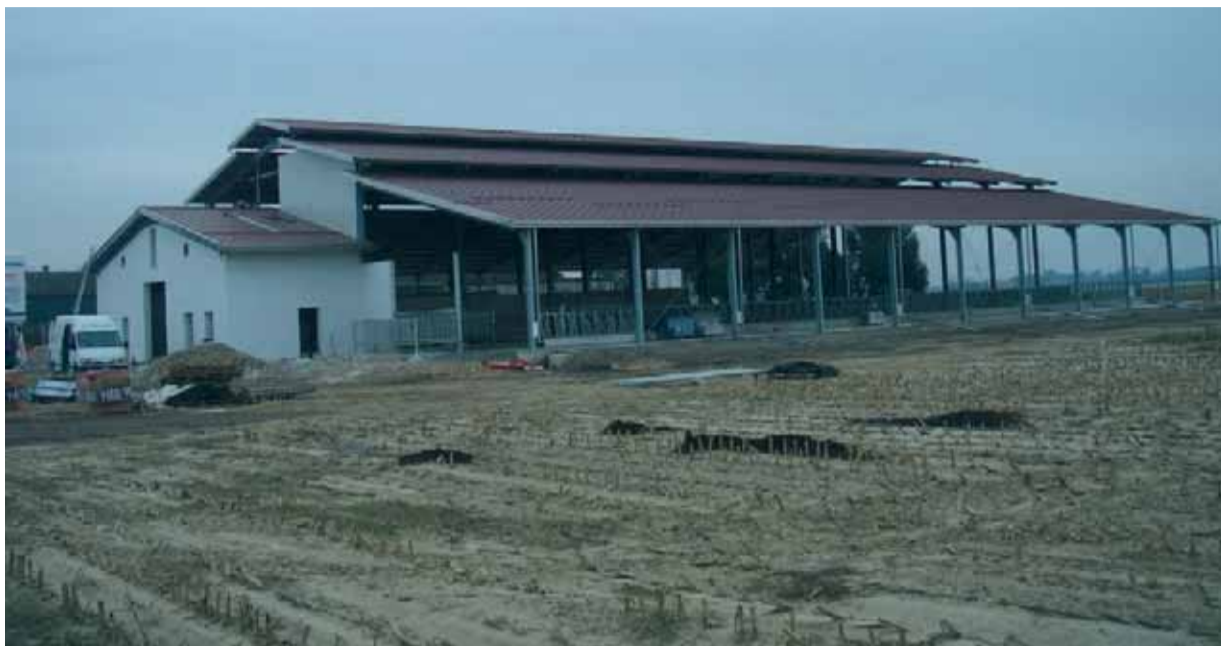
Sopra: la stalla in costruzione a Conventello in via della Colmata, ad est di Alfonsine Sotto: alcune bovine da latte nell'allevamento di Liverani