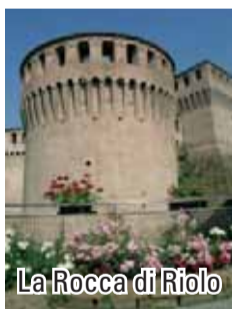
La Rocca di Riolo

Il libro narra le vicende di Marco, un giovane scrittore in piena crisi creativa, che riceve come lascito una casa da un uomo misterioso, il vecchio signor Newman. Ben presto questa donazione si rivela uno scrigno di confessioni celate per anni. Tutte le stanze hanno un ritratto appeso alla parete, volti inquietanti che sembrano voler comunicare con il nuovo proprietario. Ma cos'è che lega la vita di Marco a quella del