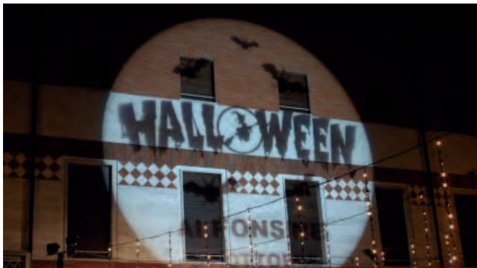
La sera di Halloween ad Alfonsine

La cosa più bella di Halloween e della sagra delle Alfonsine è il passeggiare. Mi verrebbe quasi da dire che queste due manifestazioni sono soltanto un pretesto