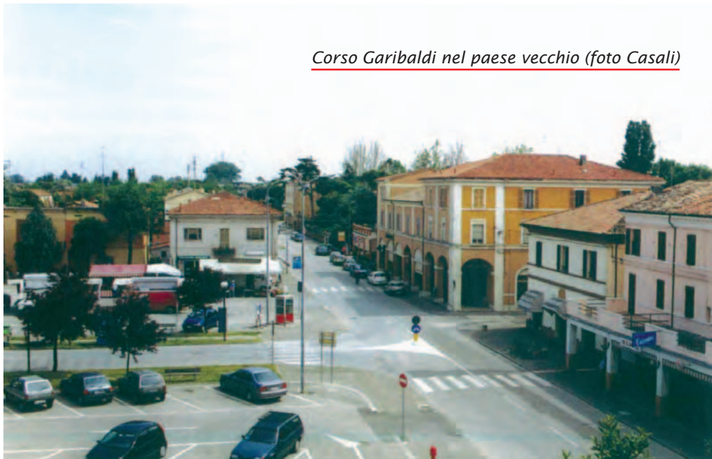
Corso Garibaldi nel paese vecchio

All'incontro erano presenti solo in pochi, ma la loro sensibilità e partecipazione era già stata dimostrata con la firma sulla petizione. Il sindaco ha dato loro atto che quel modo di partecipare era utile, segno di democrazia, apprezzabile e che era meritevole di avere risposte. Sono cittadini attenti al loro ambiente, che amano dove vivono e che chiedono all'Amministrazione di tener conto dei loro suggerimenti e segnalazioni. Sono le antenne che ci dicono come va la vita nel quartiere e cosa si deve fare per migliorarla. Sono cittadini non contro qualcuno ma per realizzare qualcosa, in collaborazione anche con la loro "Consulta Destra Senio".