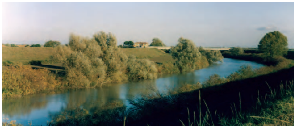
Fascia boscata del Reno in località Madonna del Bosco in un tardo pomeriggio d'autunno. Nella pagina a fianco, alba sul fiume Reno a valle di Madonna del Bosco

Le scelte che hai descritto cambieranno la geografia e forse anche l'ecologia di questo territorio: non ti sembra che si