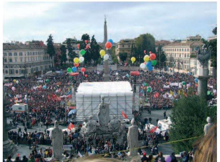
Sopra una recente manifestazione a Roma, nella pagina a fianco il ministro Maria Stella Gelmini

"Sicuramente qualcosa cambierà, nel senso che ci saranno meno possibilità e spazi per aiutare i bambini più bisognosi. Riacciacciandomi anche al discorso dei voti, sembrano proprio connaturati a questo modello di scuola che sta venendo avanti. Per adesso la legge prevede che i cambiamenti partiranno dalla prima elementare. Il tempo pieno, ad esempio, rimane un grosso punto interrogativo. Il governo sta rassicurando tutti sul suo mantenimento, ma questo rimane un dubbio: le rassicurazioni non ci rassicurano perché nel decreto non si parla di tempo pieno. Siamo tutti in ansiosa attesa di regolamenti attuativi, che non dovrebbero tardare tanto, perché a gennaio ci